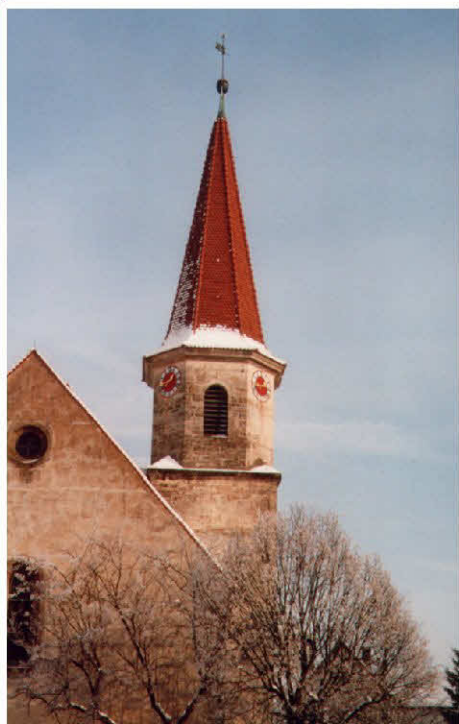
Bartholomäuskirche in Brodswinden